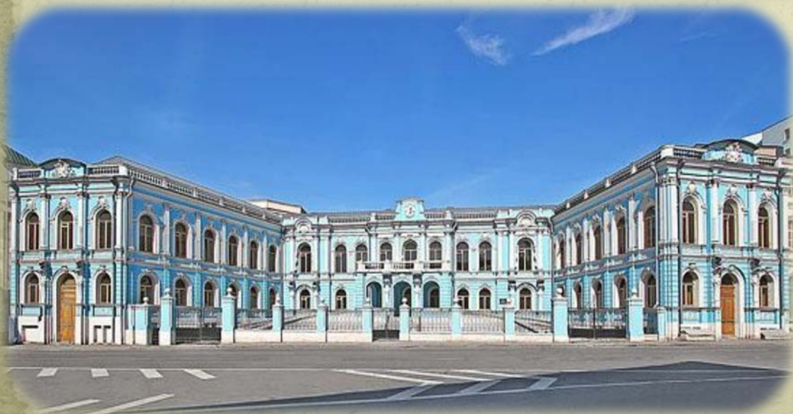
Усадьба Чертково д. 7,3