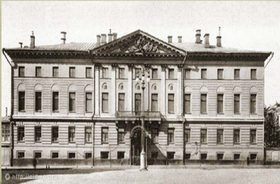
Дом генерал- губернатора Мэрия Москвы